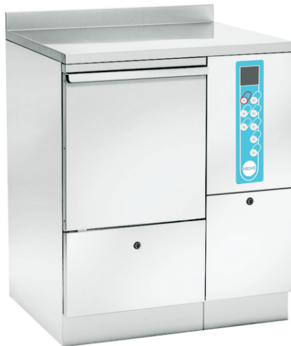
Dim. (LxPxA mm): 750x600x850