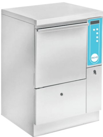
Dim. (LxPxA mm): 600x600x900