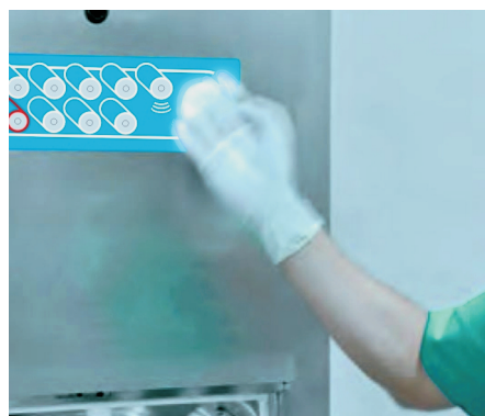
Sensor ótico no painel