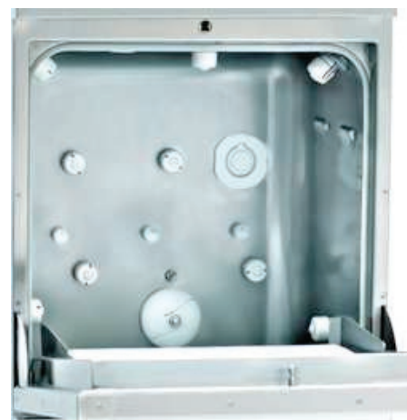
Pormenor da Câmara de Lavagem