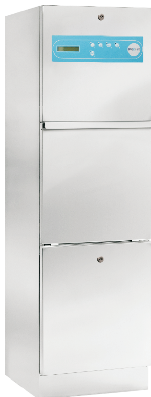
Dim. (LxPxA mm): 450x500x1500

Permite a lavagem e desinfecção de pequenos instrumentos.